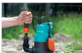
VERSATILE PER DIVERSE ESIGENZE