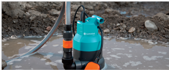
ROBUSTA PER UN UTILIZZO EFFICACE