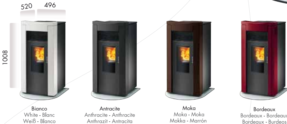
Bianco White - Blanc Weiß - Blanco